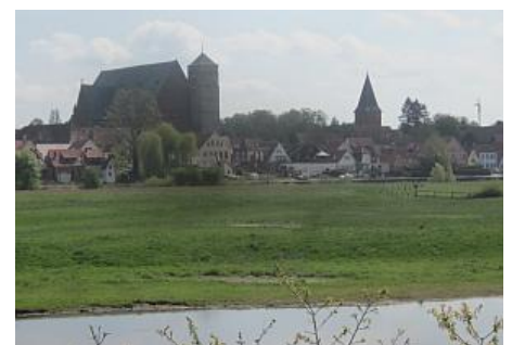
Verden mit Dom